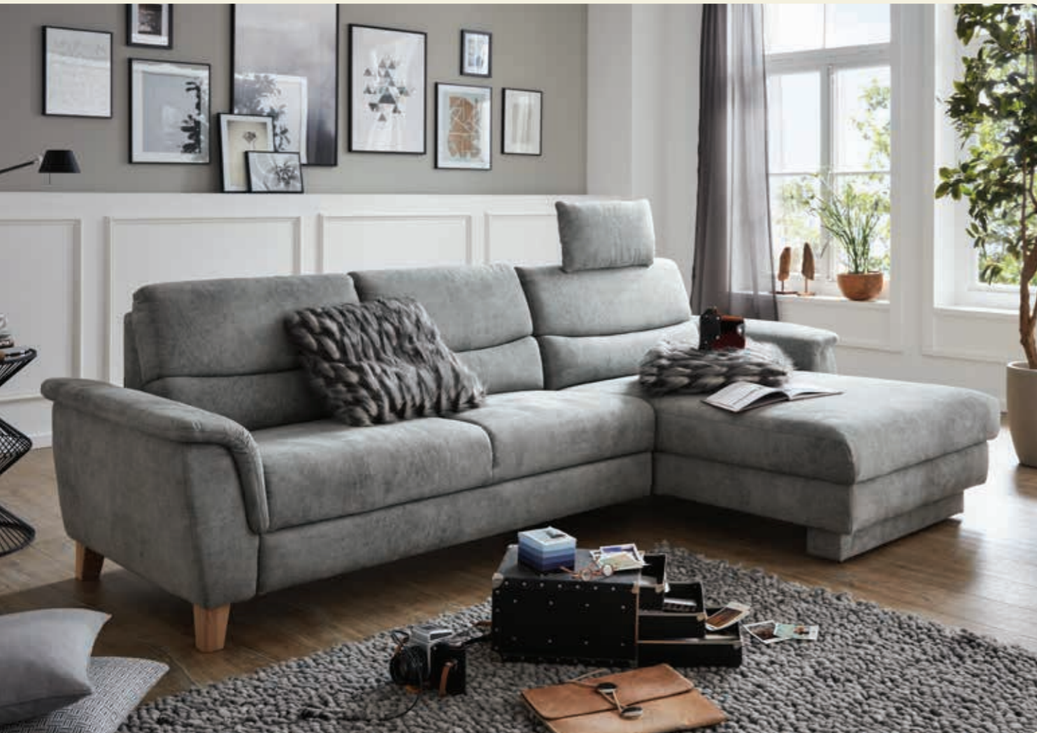
Wohnlandschaft 4841 bestehend aus 2,5-Sitzer mit Doppelbett (140 cm) und Funktionslongchair Stellmaß 278x162 cm