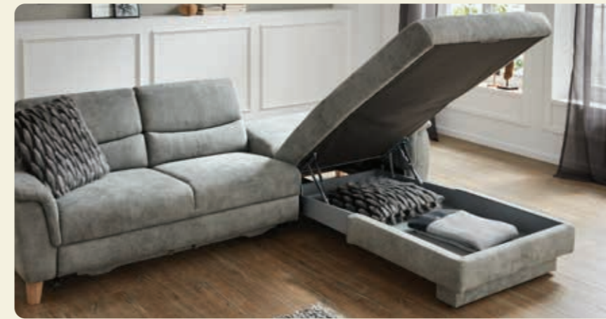
2 in 1: Entdecken Sie das Funktionslongchair mit großem Stauraum und einer Liegefläche von über 2 m Länge.

Selbe Kollektion, gleiche Funktionsvielfalt – völlig neues Design. Die Kombination dieser filigran ausgearbeiteten Rückenlehne und den komfortablen Armlehnen vermitteln dem Modell einen völlig neuen Charme. Unübertreffbar ist dabei die Funktionalität dieser kleinen Stellvariante. Nach Verwandlung von Doppelbett und Funktionslongchair ergibt sich eine riesige Liegefläche von 2,30 m x 2,08 m.