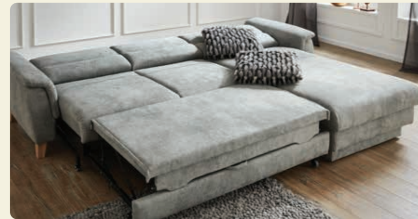
Kombinieren Sie das Funktionslongchair mit einem Doppelbett zu einem riesigen Schlaf- und Ruheplatz.